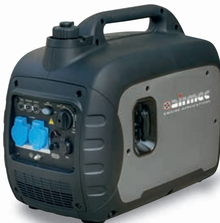
Ingresso Usb Usb plug