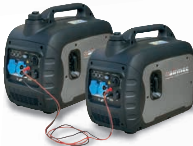
Collegabile in parallelo Connected in parallel

LED display pilot lamp e power indicator.